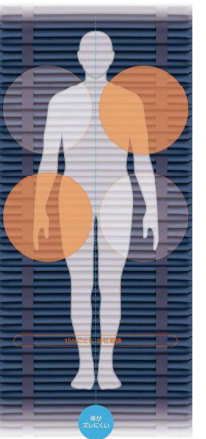
自動で小さな体位変換を頻回に行うスモールチェンジ機能。