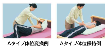
Aタイプ体位変換例 Aタイプ体位保持例