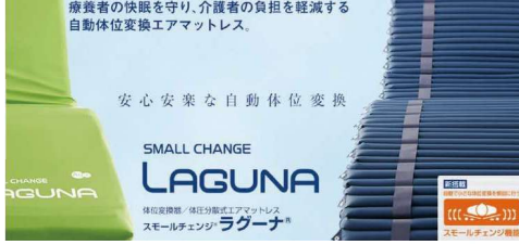
SMALL CHANGE LAGUNA