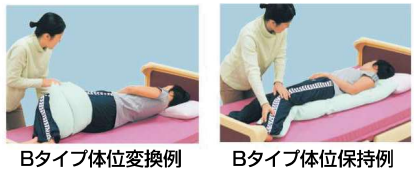
Bタイプ体位変換例 Bタイプ体位保持例