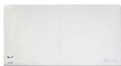
床センサーK 抗菌 防滴