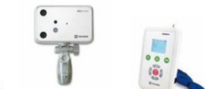
超音波・赤外線センサーK