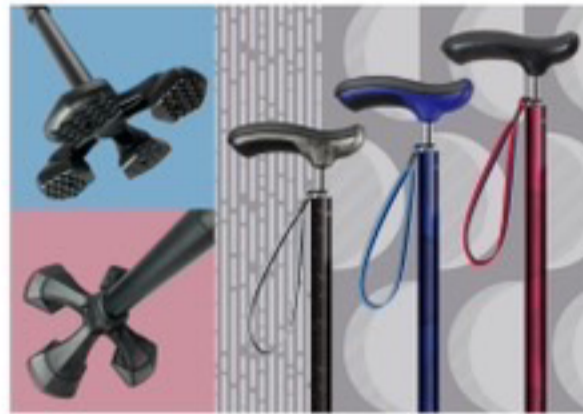
歩行を邪魔しない4点スモールベース